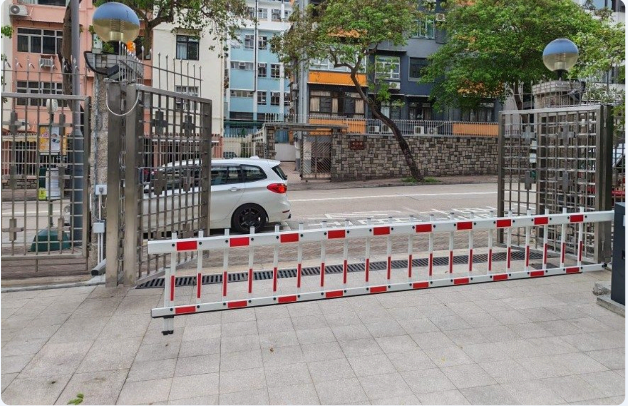
實際部署 —— 停車場車牌識別車閘出入口(ANPR 攝影機辨識號牌,車閘即時聯動放行)

傳統停車場依賴人手收費票或磁卡,存在隊伍積壓、人工核對耗時、事故取證不便等痛點。新科以高精度 ANPR 攝影機辨識進出車輛號牌,配合車閘即時聯動,實現無票、不停車的出入流程,大幅降低車道等待與管理成本。